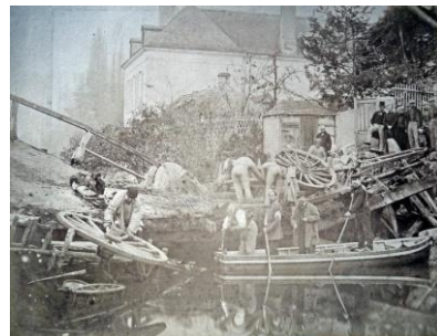
1 ère photo-reportage : Le pont Saint Bié