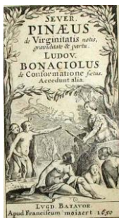
Traité de Pineau

Cycle de conférences animé par Colette BEAUNE