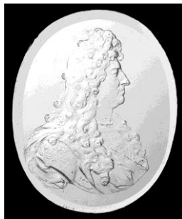
Inventeurs du XVIIe