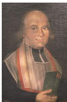
Le « crapaud de nuit »

Cycle de conférences animé par Colette BEAUNE