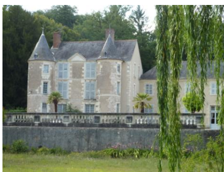
Le petit château de Monteaux